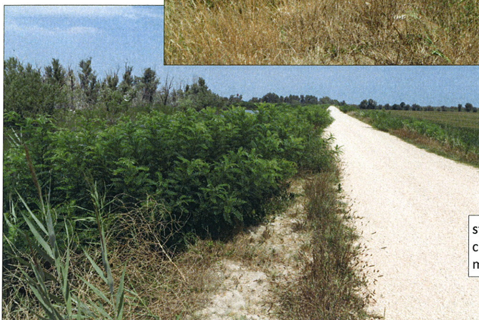
st. 652/A in località Bar- chessa Ravagnan del Co- mune di Porto Viro