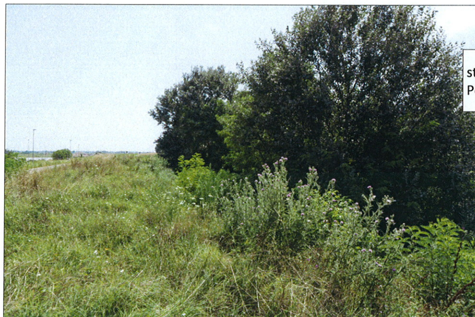
st. 525 in località Cavanella Po del Comune di Loreo