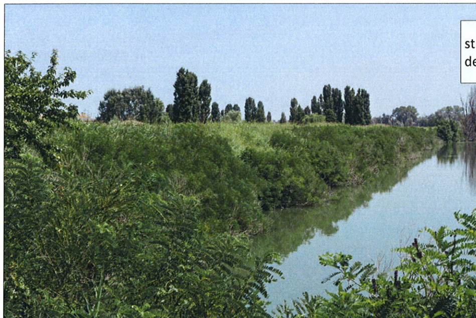
st. 617 in località Cà Pisani del Comune di Porto viro