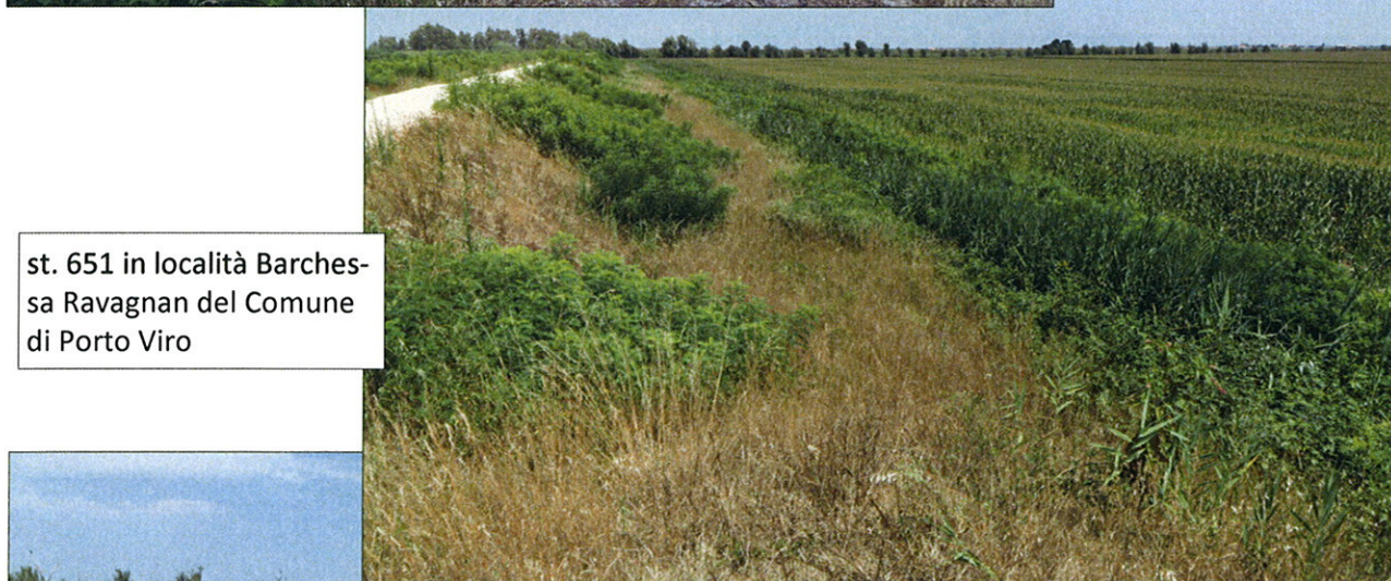
st. 651 in località Barchessa Ravagnan del Comune di Porto Viro