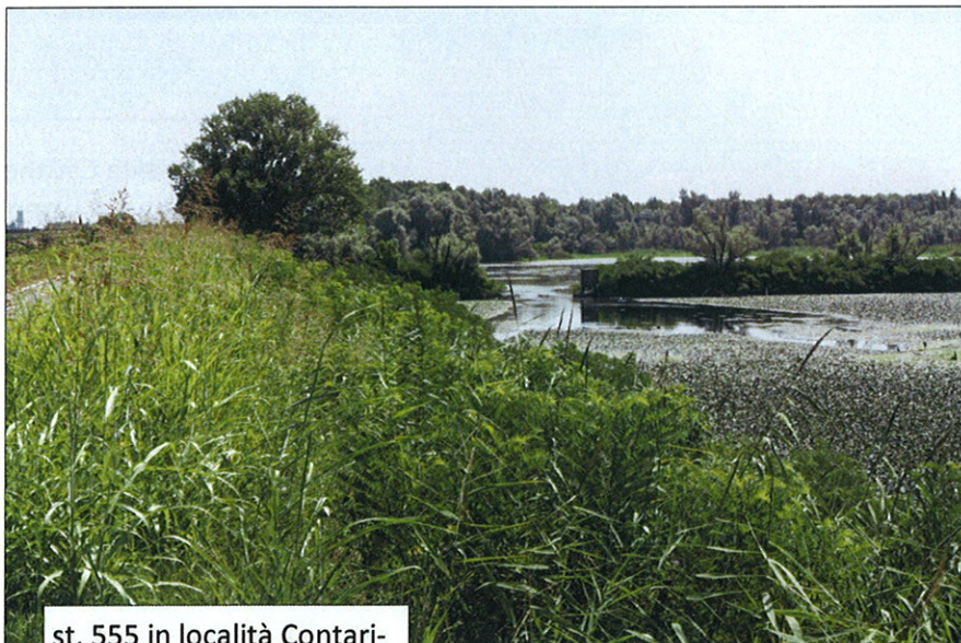
st. 555 in località Contarina del Comune di Porto Viro