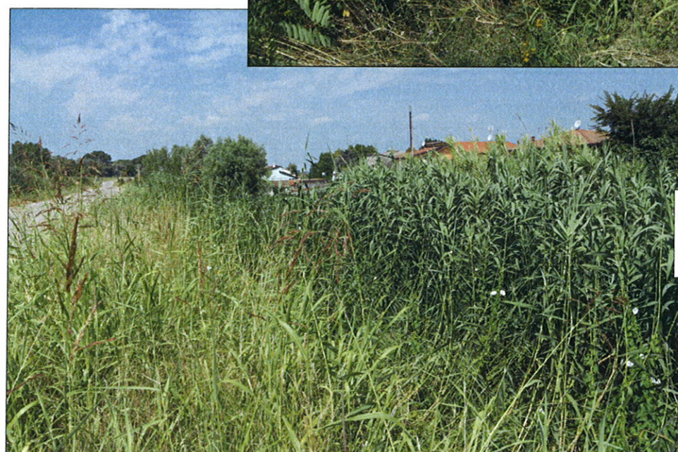
st. 550 in località Contarina del Comune di Porto Viro