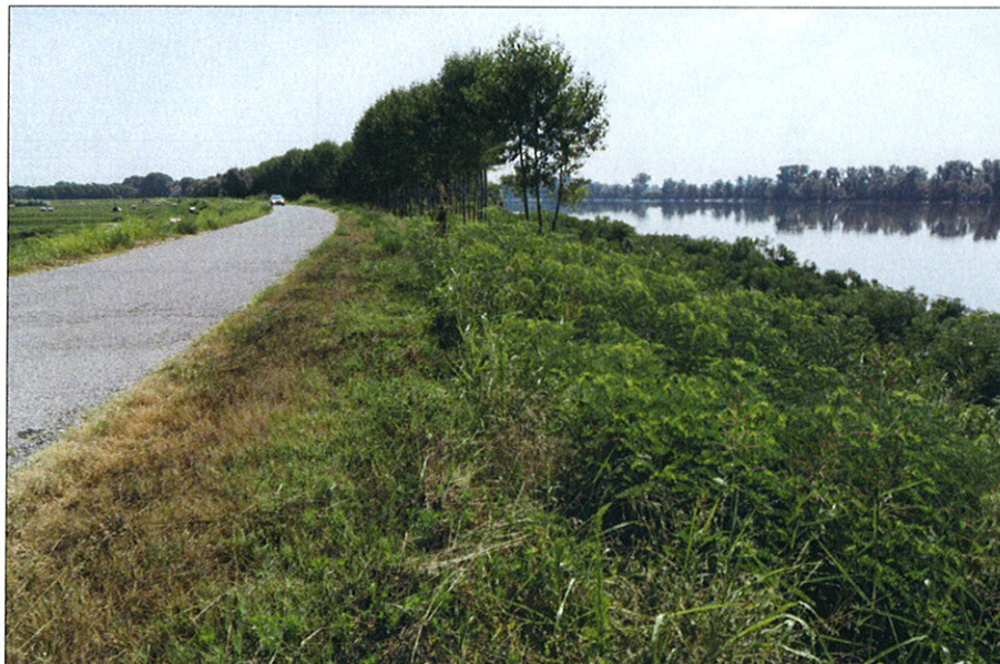
Stato di fatto in sinistra Po di Venezia tra gli st. 460-461 in località Panarella del Comune di Papozze