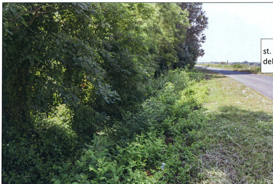
st. 480 in località Panarella del Comune di Papozze