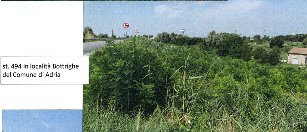
st. 494 in località Bottrighe del Comune di Adria