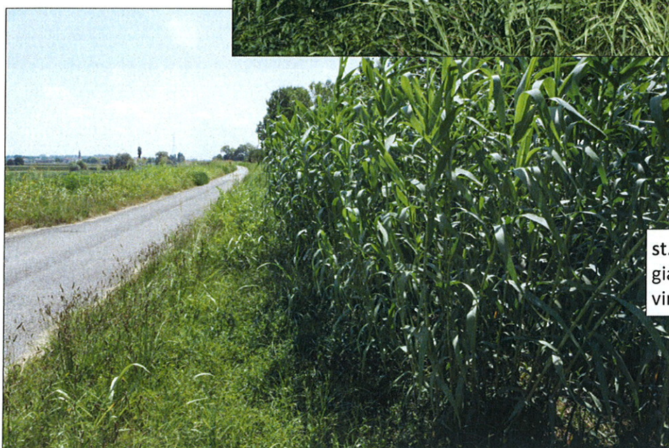
st. 504 in località Villare- gia del Comune di Porto viro