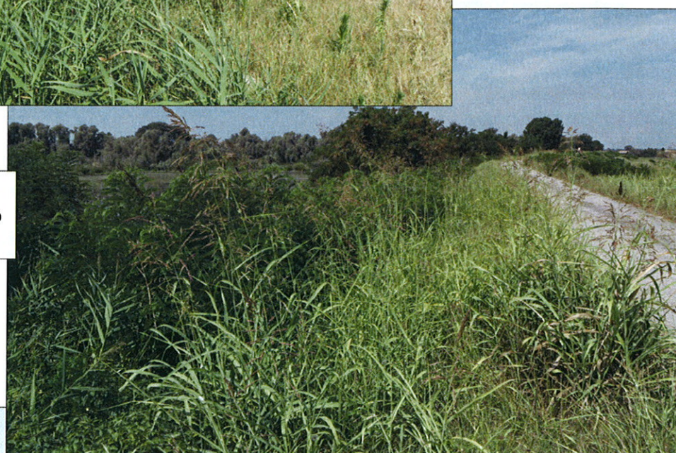
st. 598 in località Cà Cor- nera del Comune di Porto Viro