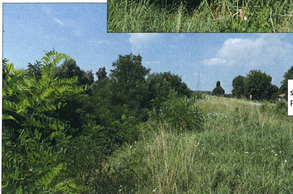
st. 523 in località Cavanella Po del Comune di Adria