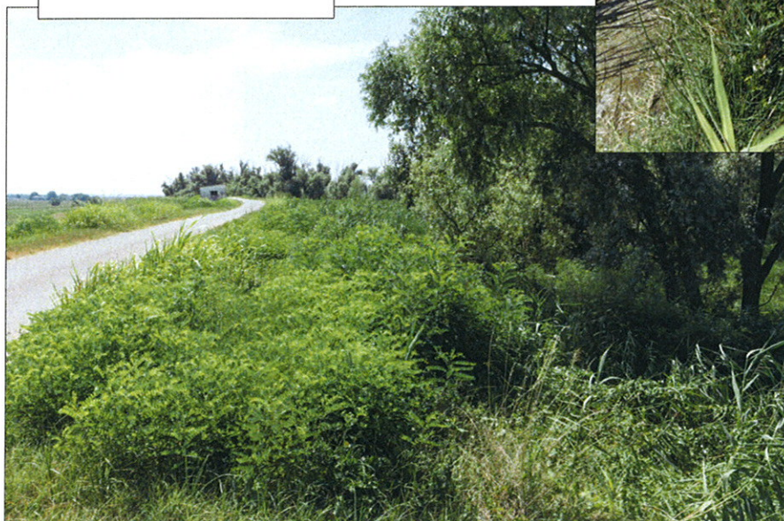
st. 463 in località Contarina di Porto Viro