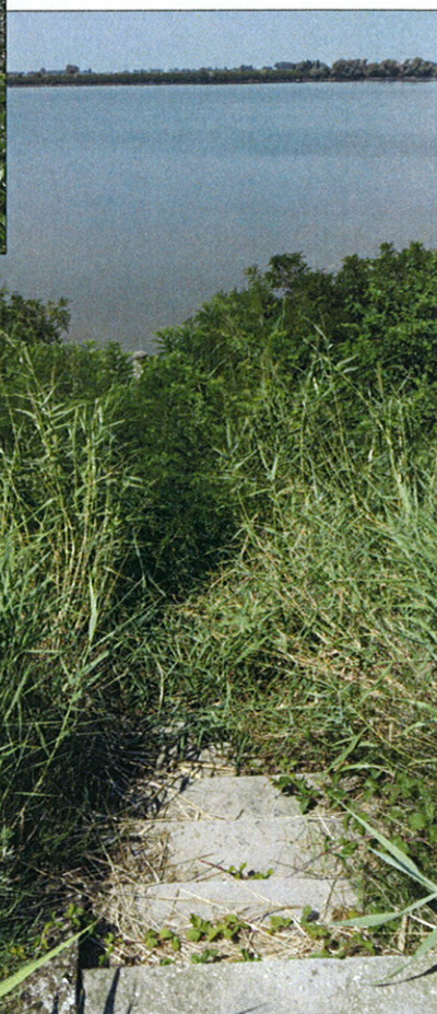
st. 567 Idrometro di Cà Cappellino