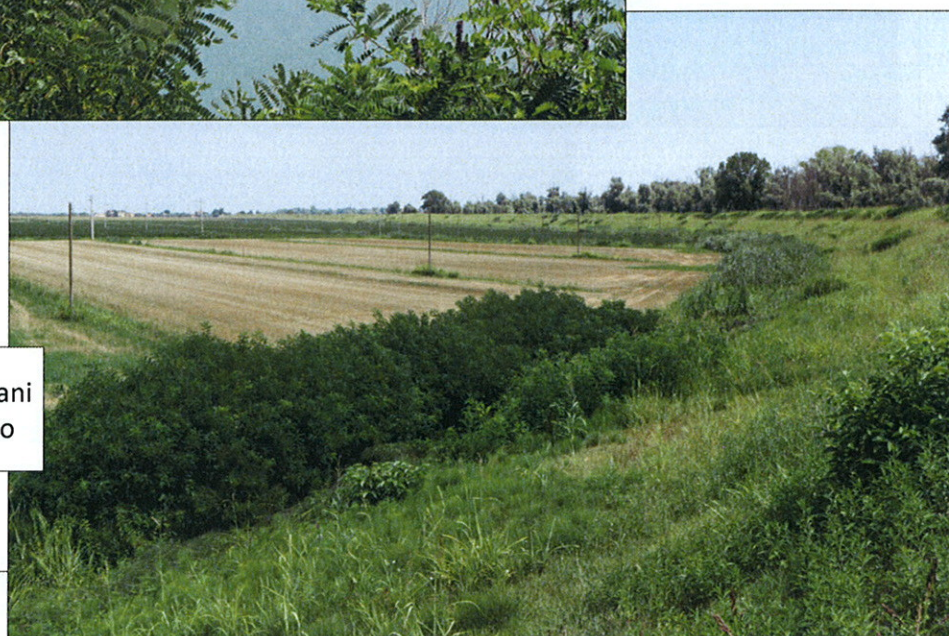
st. 620 in località Cà Pisani del Comune di Porto viro