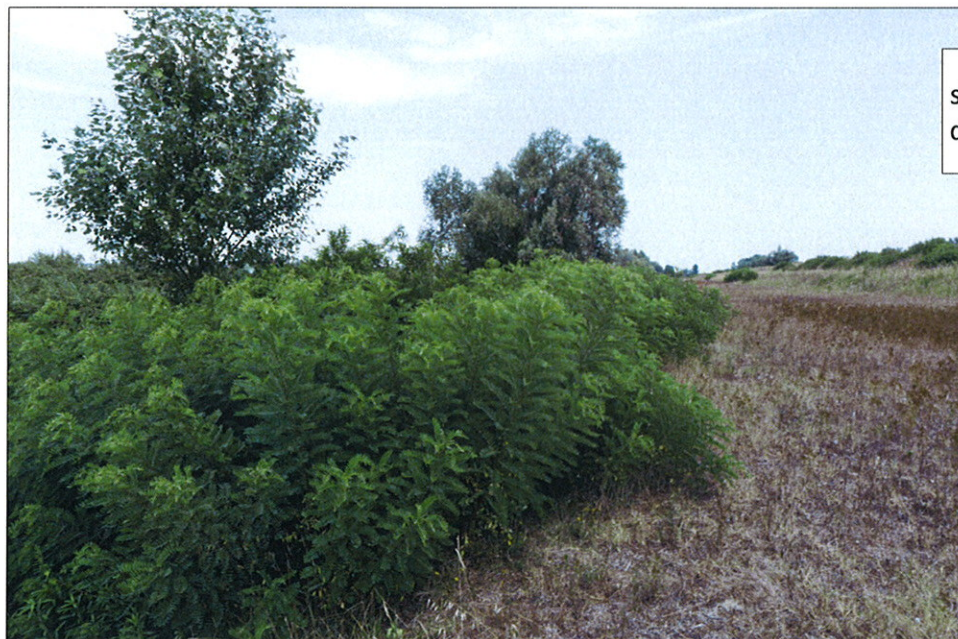
st. 635 in località Cà Pisani del Comune di Porto Viro