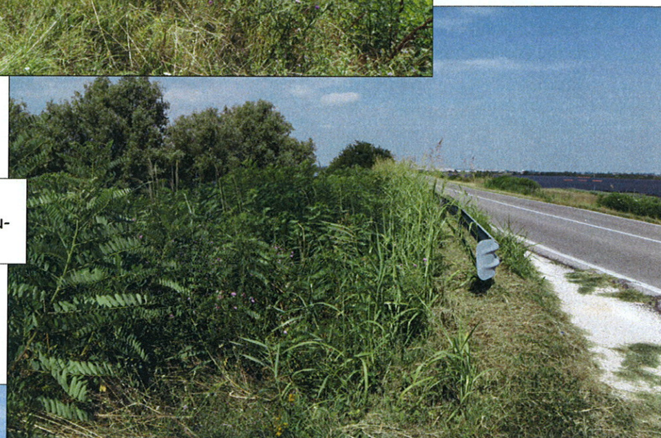
st. 539 in località Conca Volta Grimana del Comune di Loreo