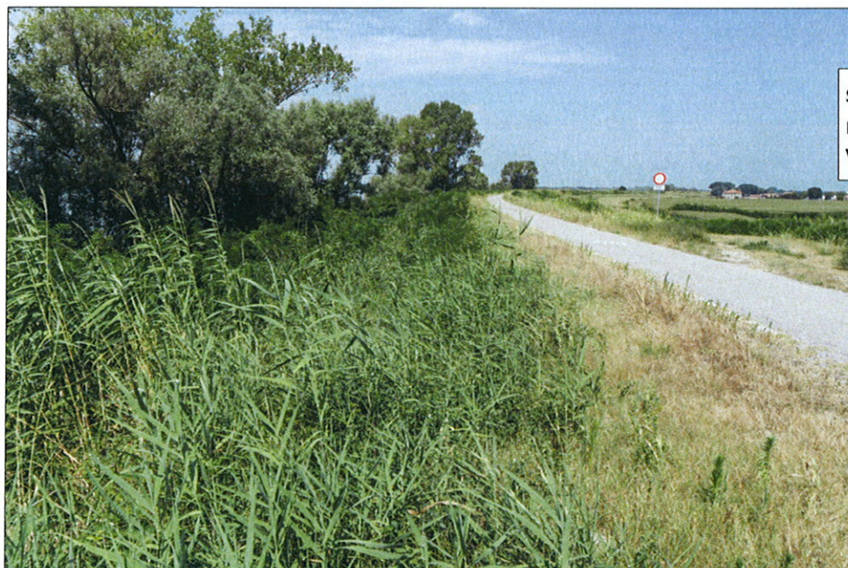
st. 590 in località Cà Cor- nera del Comune di Porto Viro